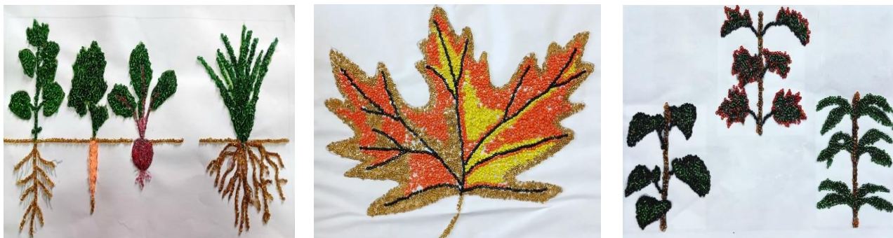
Рис. Самодельные наглядные пособия, выложенные бисером, изготовленные учащимися

Такие задания можно выполнять и по другим темам (темы названы выше). Эти задания помогут учащимся думать, развить мышление, глубже понять строение органов растений, приобщат учащихся к самостоятельной творческо-исследовательской деятельности, запомнятся на всю жизнь, пробудят интерес к предмету, откроют путь к становлению настоящего биолога, научат любить природу и бережно относиться к ней.